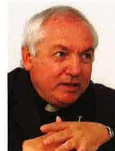
Mgr. Jean-Marc AVELINE

Théologien catholique belge, professeur titulaire de théologie pratique à la Faculté de théologie et de sciences des religions de la KU Leuven (Université catholique de Leuven)